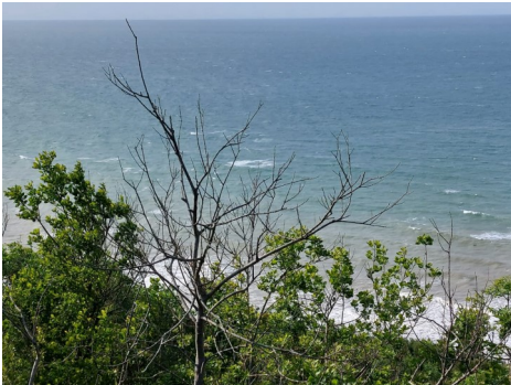
Ausblick von der Batterie Longues-sur-Mer

Wenige Orte verbinden historische Ereignisse mit einer derart reizvollen Landschaft, wie man Sie in der Normandie findet. Die für die Region typi-