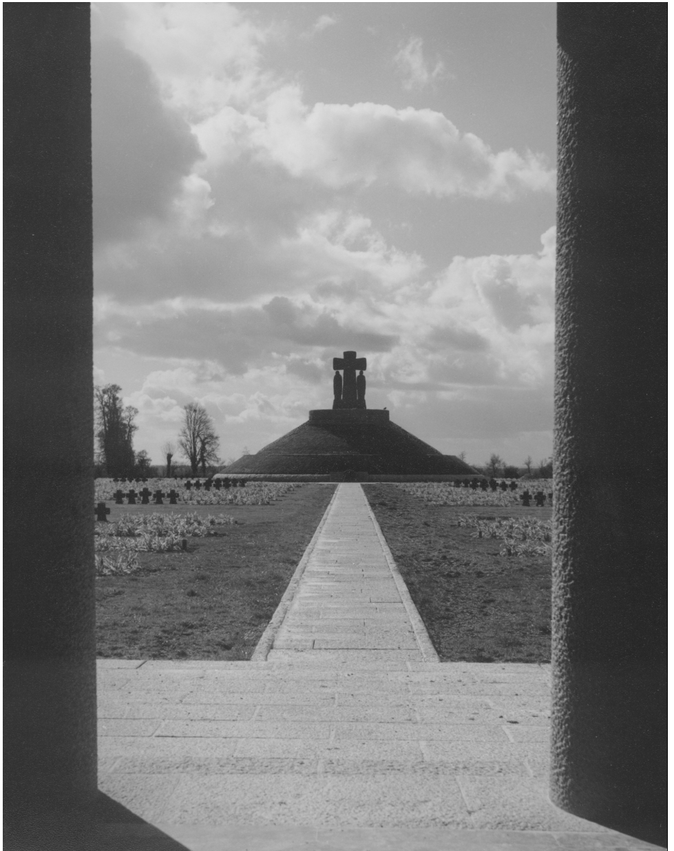
Deutsche Kriegsgräberstätte La Cambe/Normandie, ca. 1961. Hier ruhen 21.245 deutsche Gefallene des Zweiten Weltkrieges.