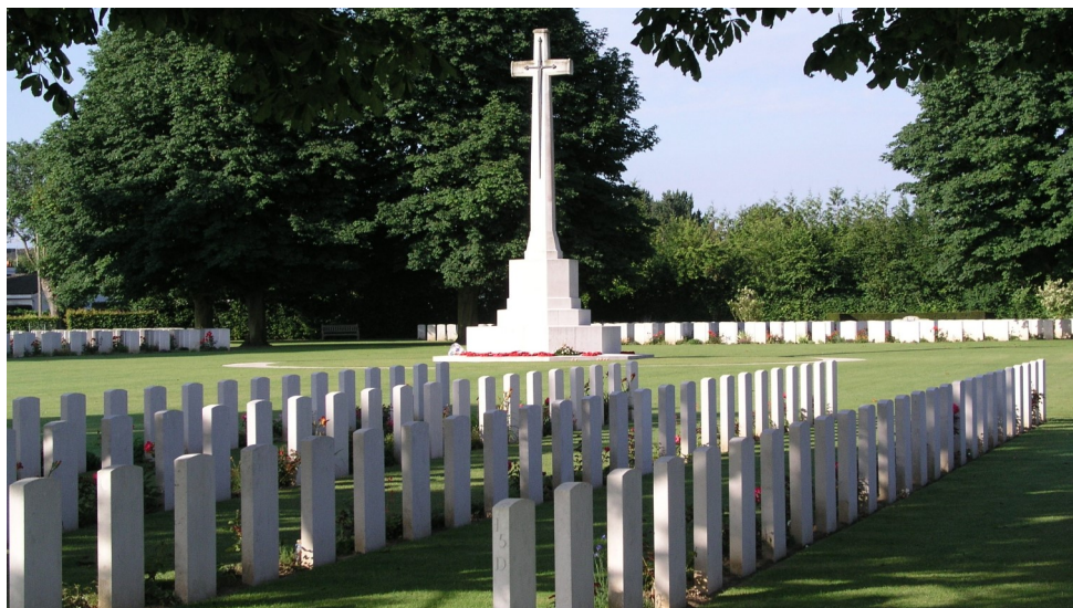
Britische Kriegsgräberstätte Bayeux